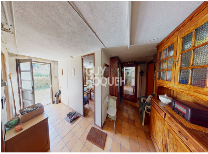
Photo du bien