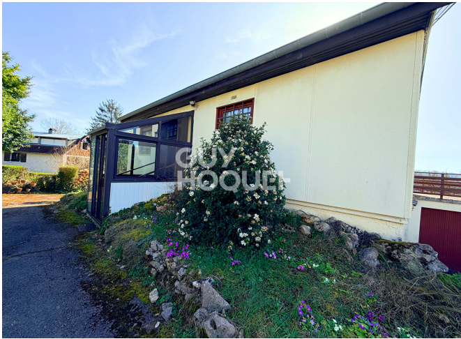
Photo du bien